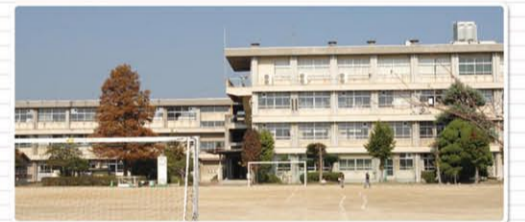
第四福田小学校まで 徒歩8分