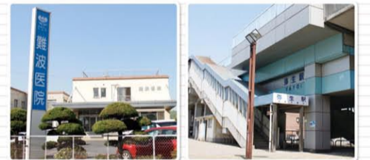
難波医院まで徒歩5分