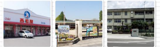
西松屋北畝店まで徒歩3分